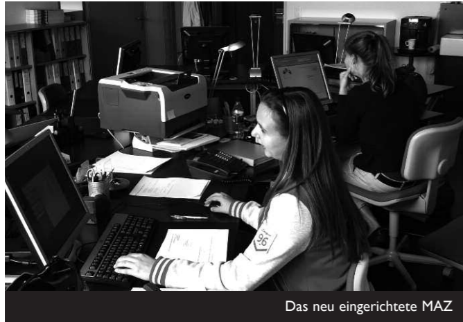
Das neu eingerichtete MAZ

Die Veränderungen des Reformprojekts haben im letzten Schuljahr auch die Infrastruktur des bwd erfasst. Damit die Praxisfirma verwirklicht werden kann, mussten Unterrichts- und Vorbereitungszimmer des Fachs Zeichnen/Bildnerisches Gestalten und im Gegenzug das Büro des Material- und Ausbildungszentrums MAZ verlegt werden. Zudem wird auf den Sommer hin eines der beiden Naturwissenschafts-Zimmer aufgehoben. In den Frühlingferien konnte dank der grossen Unterstützung der betroffenen Fachlehrkräfte und der Zentralen Dienste das Zügelprojekt ohne Verzug wie geplant durchgeführt werden. Besten Dank!