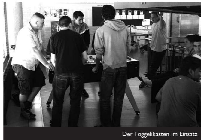
Der Töggelikasten im Einsatz

Die vier beliebtesten und am häufigsten gebrauchten Einrichtungsgegenstände des bwd befinden sich in der Eingangshalle und ziehen in jeder Pause bewegungs- und denkfrequente Lernende an: der neue Tischtennistisch, der solide Töggelikasten, das Mini-Trampolin und das Boden-Schachspiel. Die vier Pausenfüller sind bereits nicht mehr wegzudenken. Vorschläge für die Ergänzung des Pausenangebots werden gerne entgegen genommen.